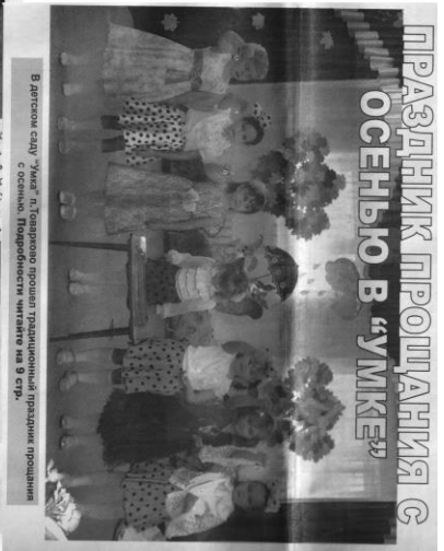
В детском саду «Умка» п.Товарково прошёл традиционный праздник прощания с осенью. Подобранные кадры на 9 стр.